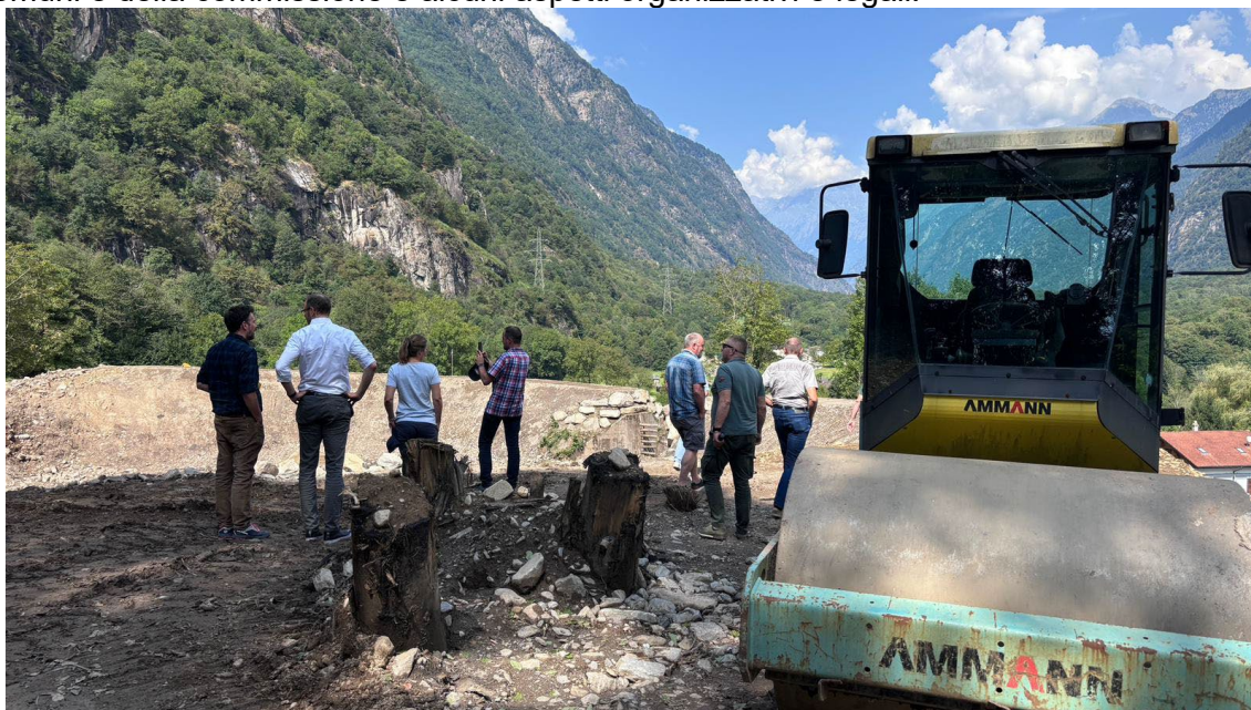
Visita Commissione dei fondi alle aree colpite dal maltempo