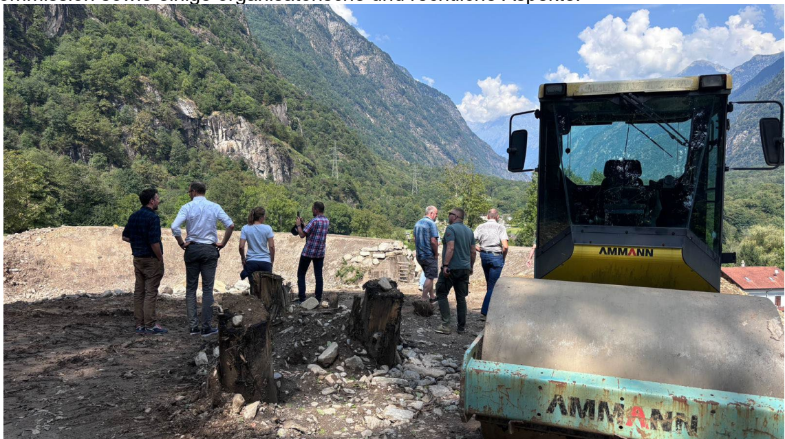
Besuch der Kommission in den von den Unwettern betroffenen Gebieten